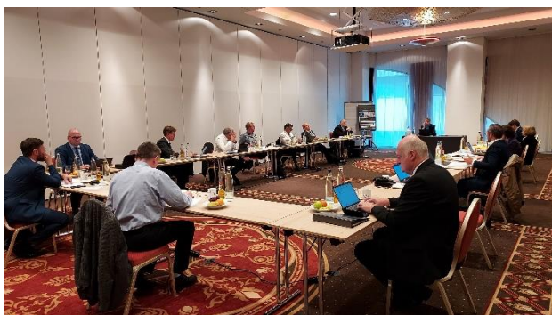
Die Verhandlungskommission der VKA hat während des Verhandlungsauftritts zwischenzeitlich immer wieder die Ausführungen des Marburger Bundes bewertet.

Vor dem Hintergrund der problematischen wirtschaftlichen Situation der kommunalen Krankenhäuser würde der Forderungskatalog des Marburger Bundes Mehrkosten von mindestens 420 Millionen Euro verursachen. Noch schwerer wiegen jedoch die geforderten (weiteren) Einschränkungen bei Ruf- und Bereitschaftsdiensten, die erhebliche Belastungen in der Arbeitsorganisation der Kliniken mit sich bringen und die Lage der Häuser enorm verschärfen würden. Diese würden in der Praxis dazu führen, dass teilweise Leistungen der Gesundheitsversorgung durch die kommunalen Krankenhäuser nicht mehr erbracht werden könnten. Insbesondere kleine Abteilungen sind aufgrund ihrer geringeren Personalausstattung besonders stark betroffen.